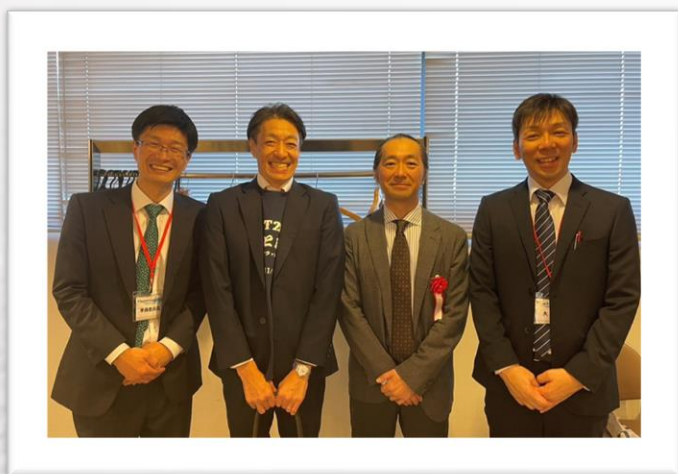
講師2名と大会長・準備委員長

どちらもとても有意義な時間となり、若手からベテランまでの多くの参加者の『前進』への後押しになったのではないのでしょうか。