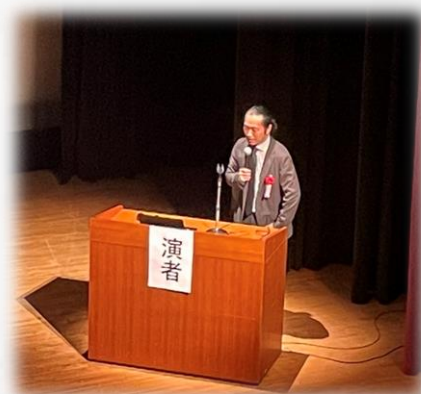
美崎先生の講演の様子